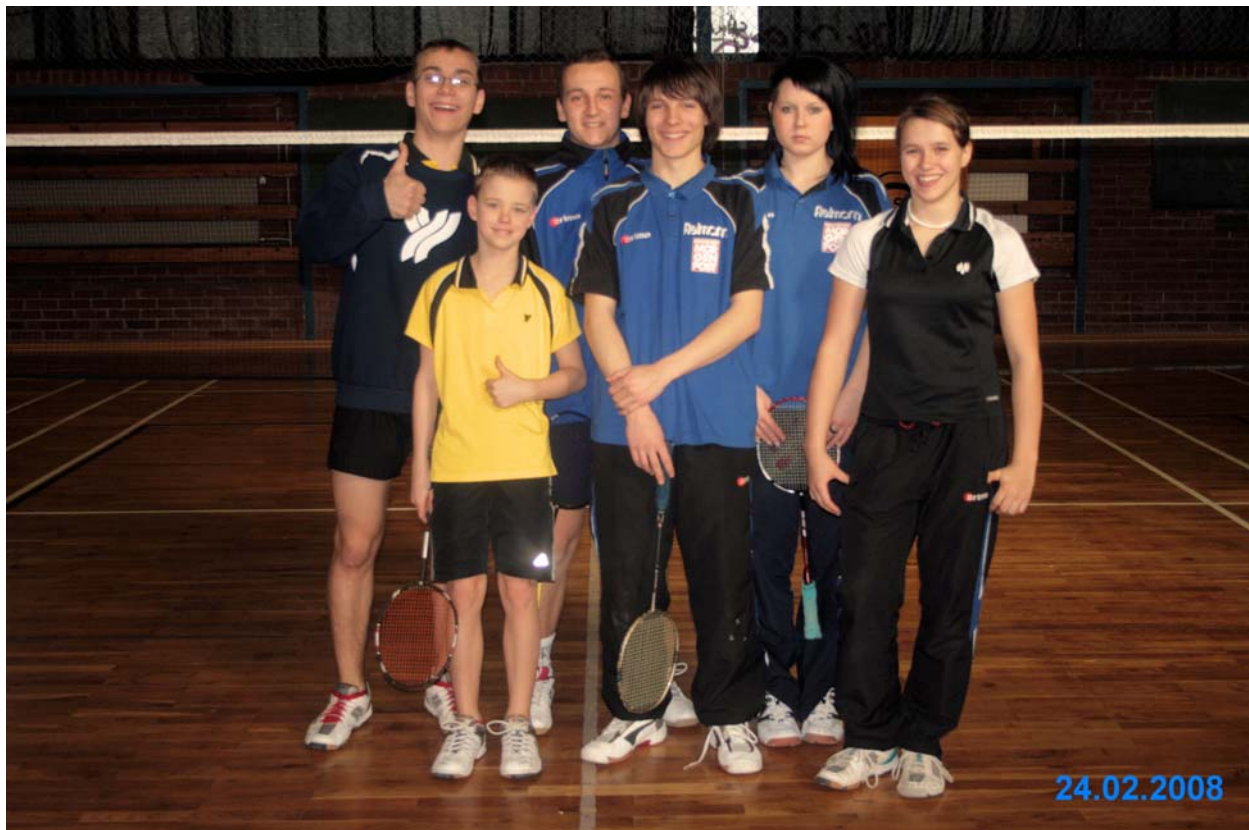
SV Demitz-Thumitz – Jugend