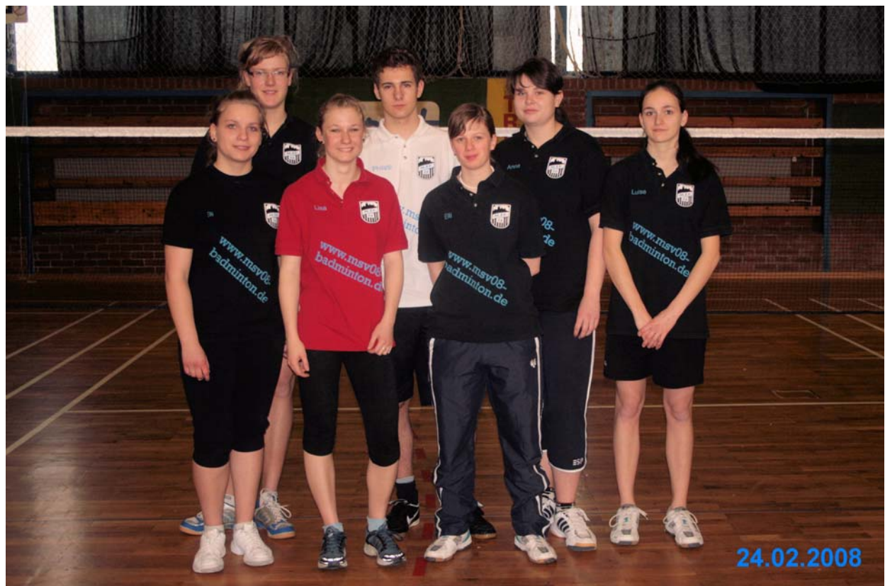
Meißner SV 08 – Jugend