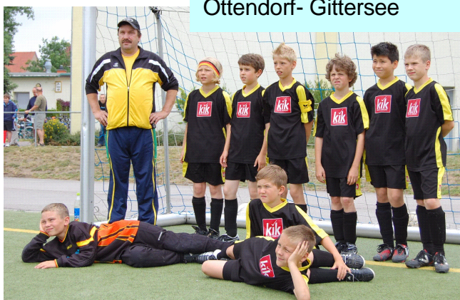
Die Mannschaft am Turniertag